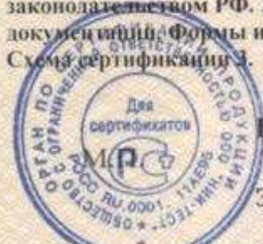
Схема сертификации З.

ДОПОЛНИТЕЛЬНАЯ ИНФОРМАЦИЯ Маркировка на русском языке в соответствии с действующим законодательством РФ. Знак соответствия наносят на товарный ярлык и в товаросопроводительной документации. Формы и размеры знака - по ГОСТ 50460-92.